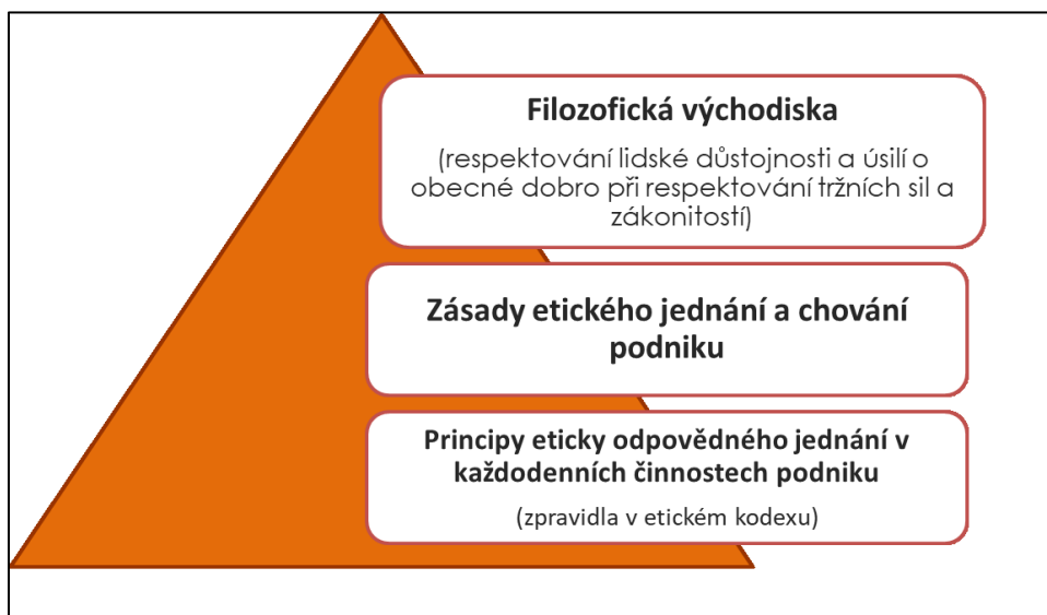
Obrázek 6: Dimenze etického řízení