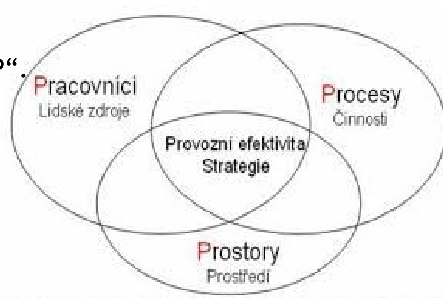
Obr 1. : Definice „3P“.

Zdroj: VYSKOČIL, V., ŠTRUP, O. a PAVLÍK, M. Facility management a public private partnership. 2007.