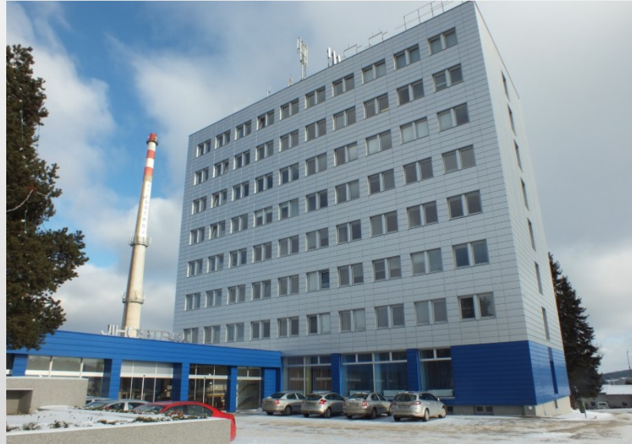
obr. 1 Firma Jihostroj a.s.