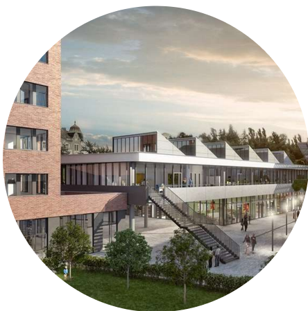
CENTRUM NOVÁ PALMOVKA Praha 8