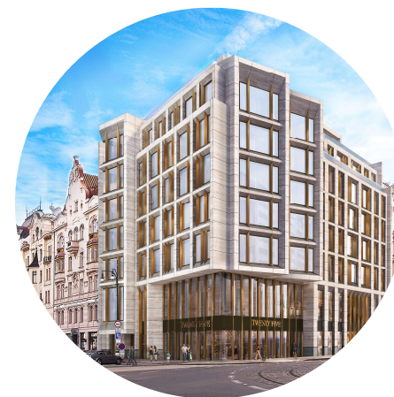
PAŘÍŽSKÁ Č.P. 25 Pařížská, Praha 1