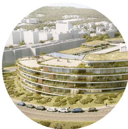
MOTOLSKÉ ONKOLOGICKÉ CENTRUM areál Fakultní nemocnice v Motole, Praha 5