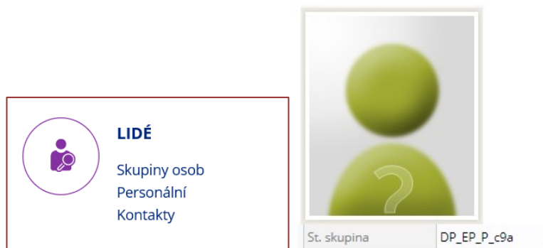
Obrázek 3: Ukázka v IS- > Lidé