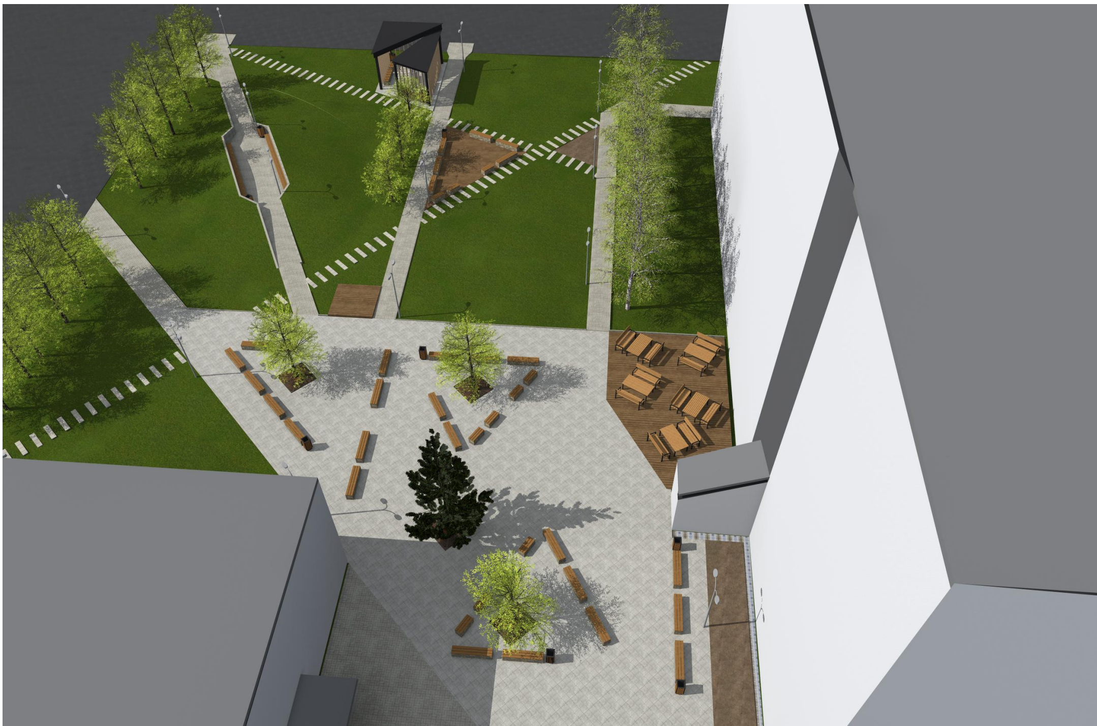
NADHLEDOVÁ PERSPEKTIVA OD JIHU