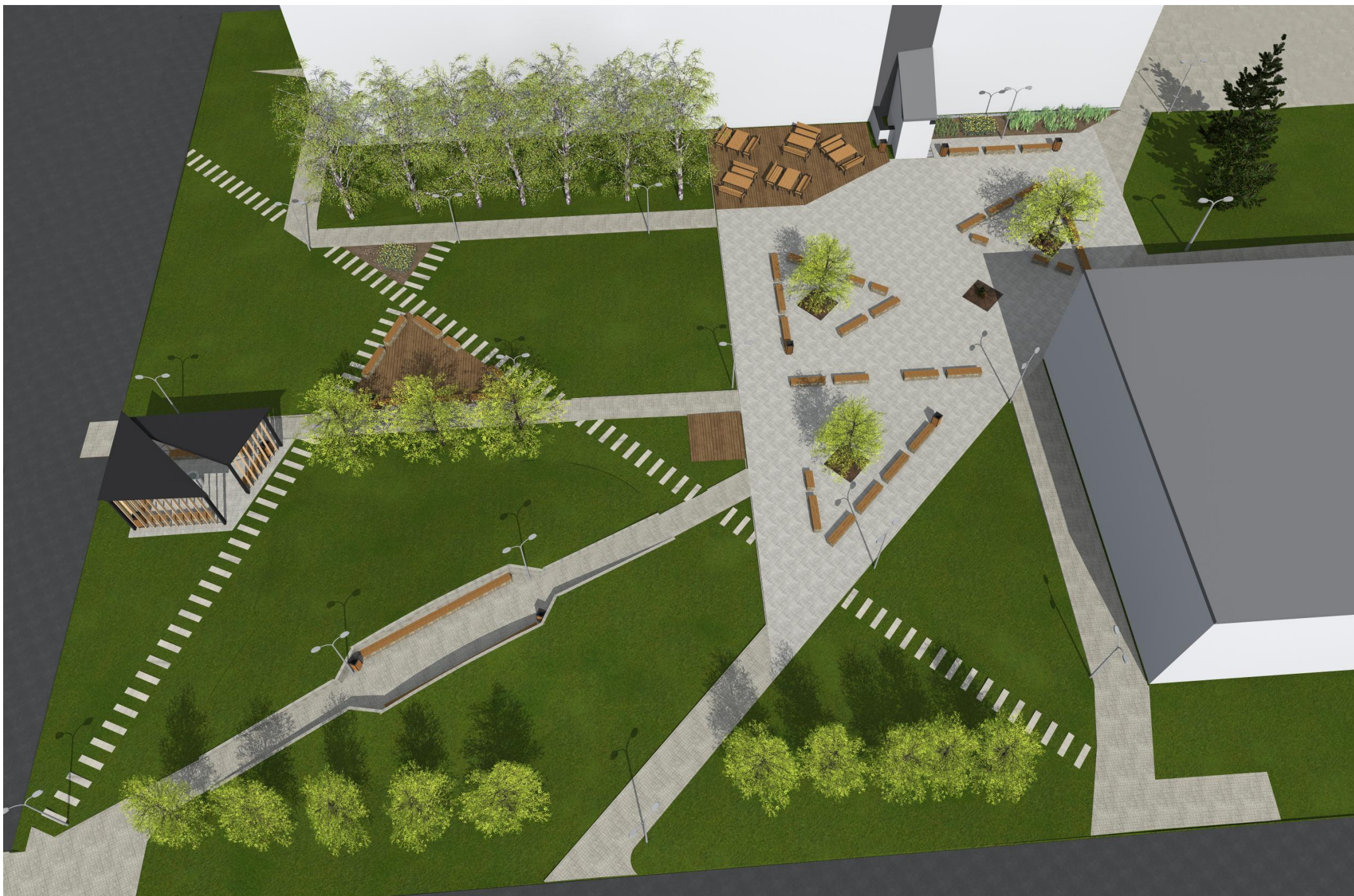
NADHLEDOVÁ PERSPEKTIVA OD PARKOVIŠTĚ