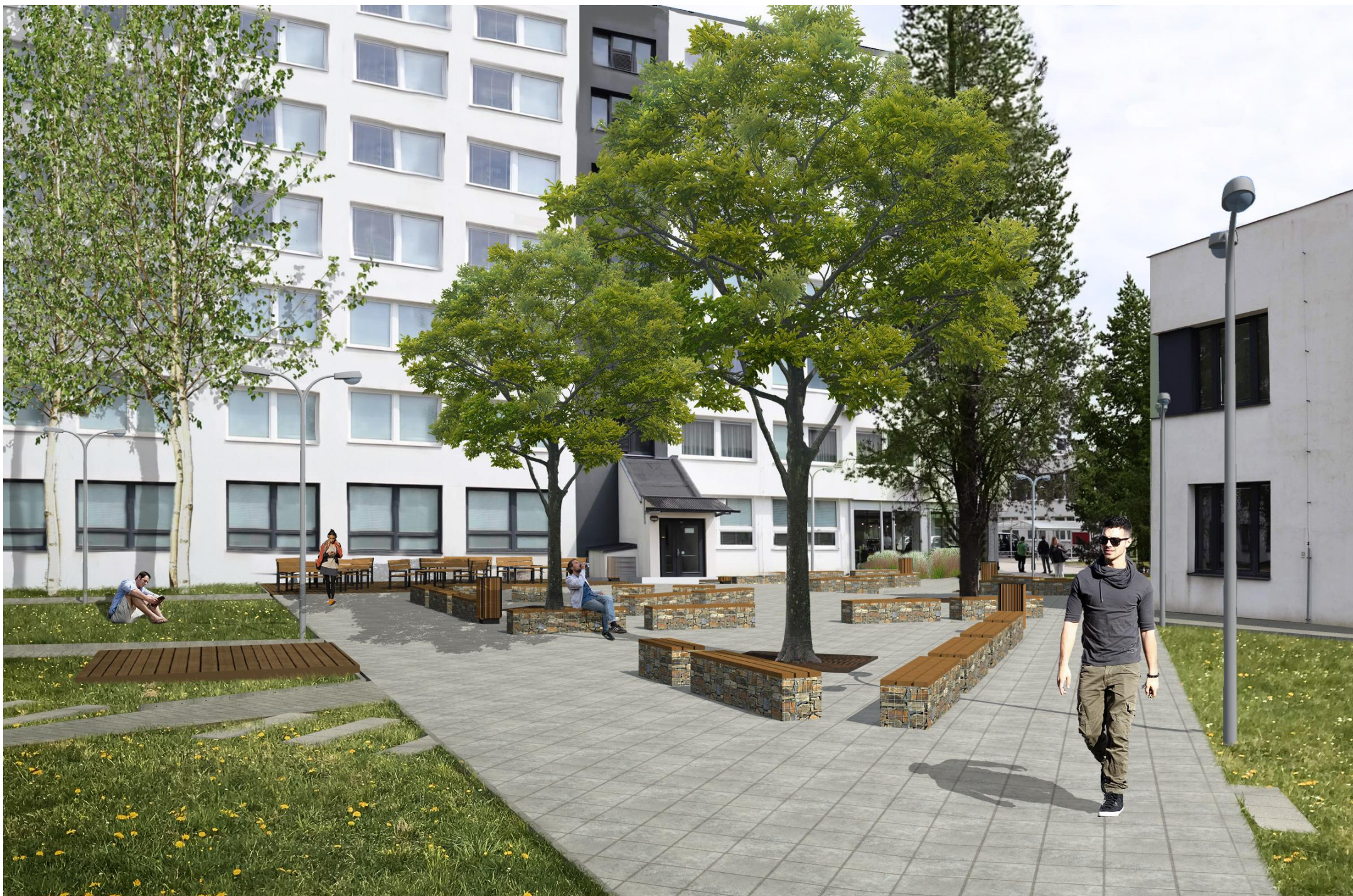
VIZUALIZACE HLAVNÍHO ODPOČINKOVÉHO PROSTORU