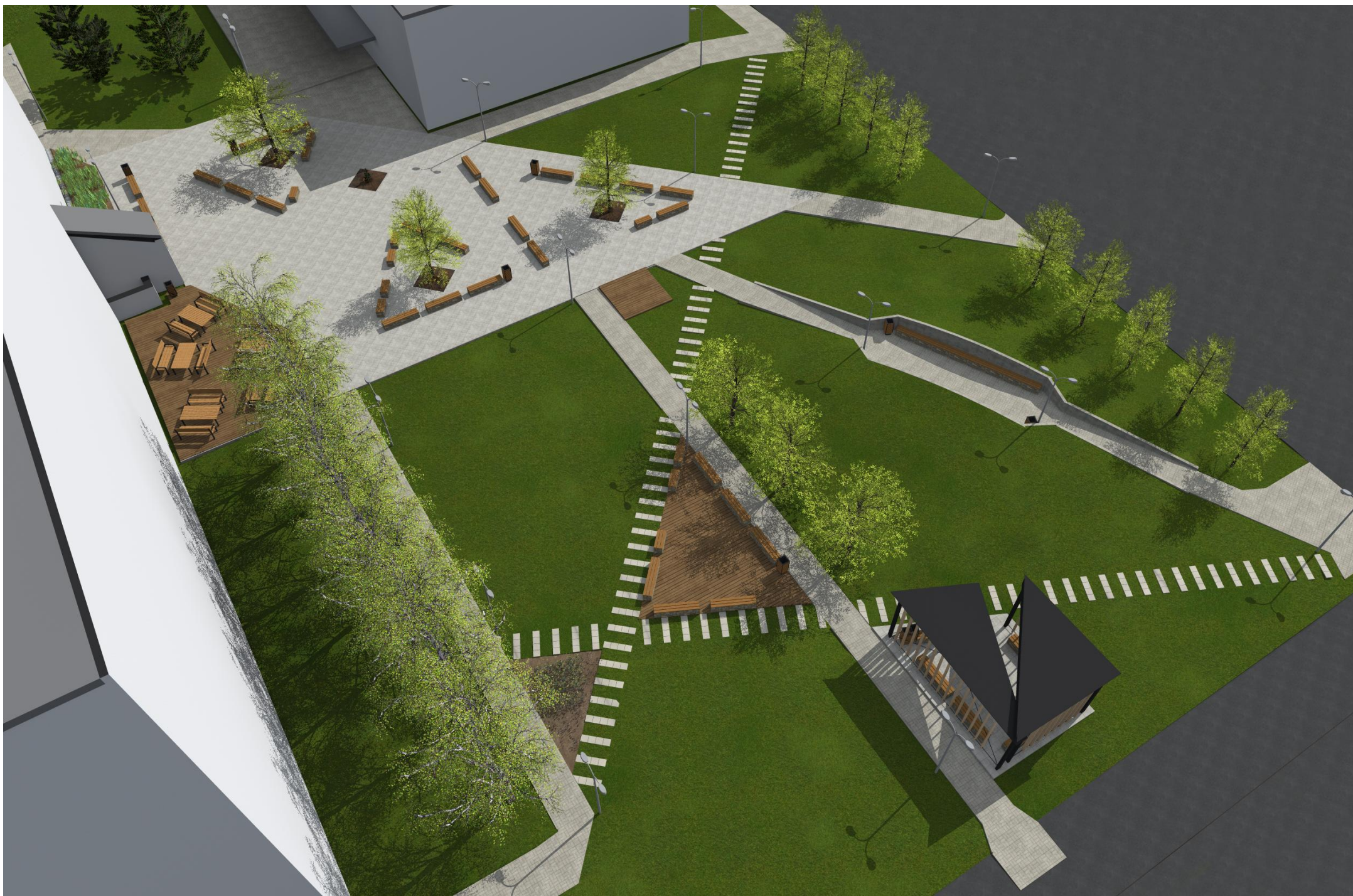
NADHLEDOVÁ PERSPEKTIVA OD SEVEROVÝCHODU