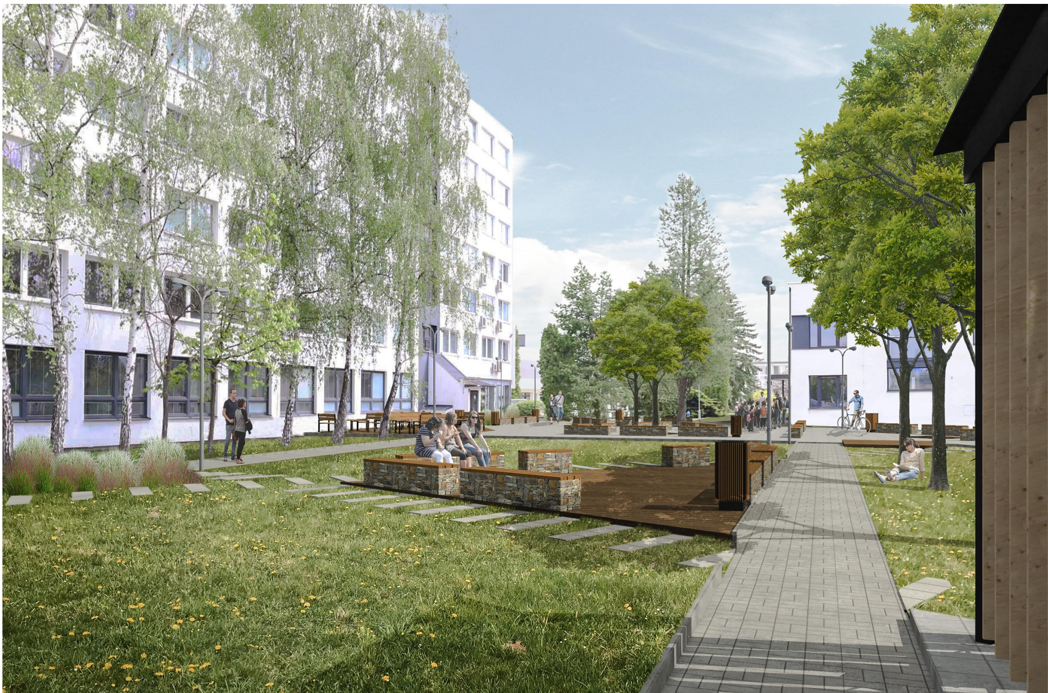
VIZUALIZACE OD ALTÁNU