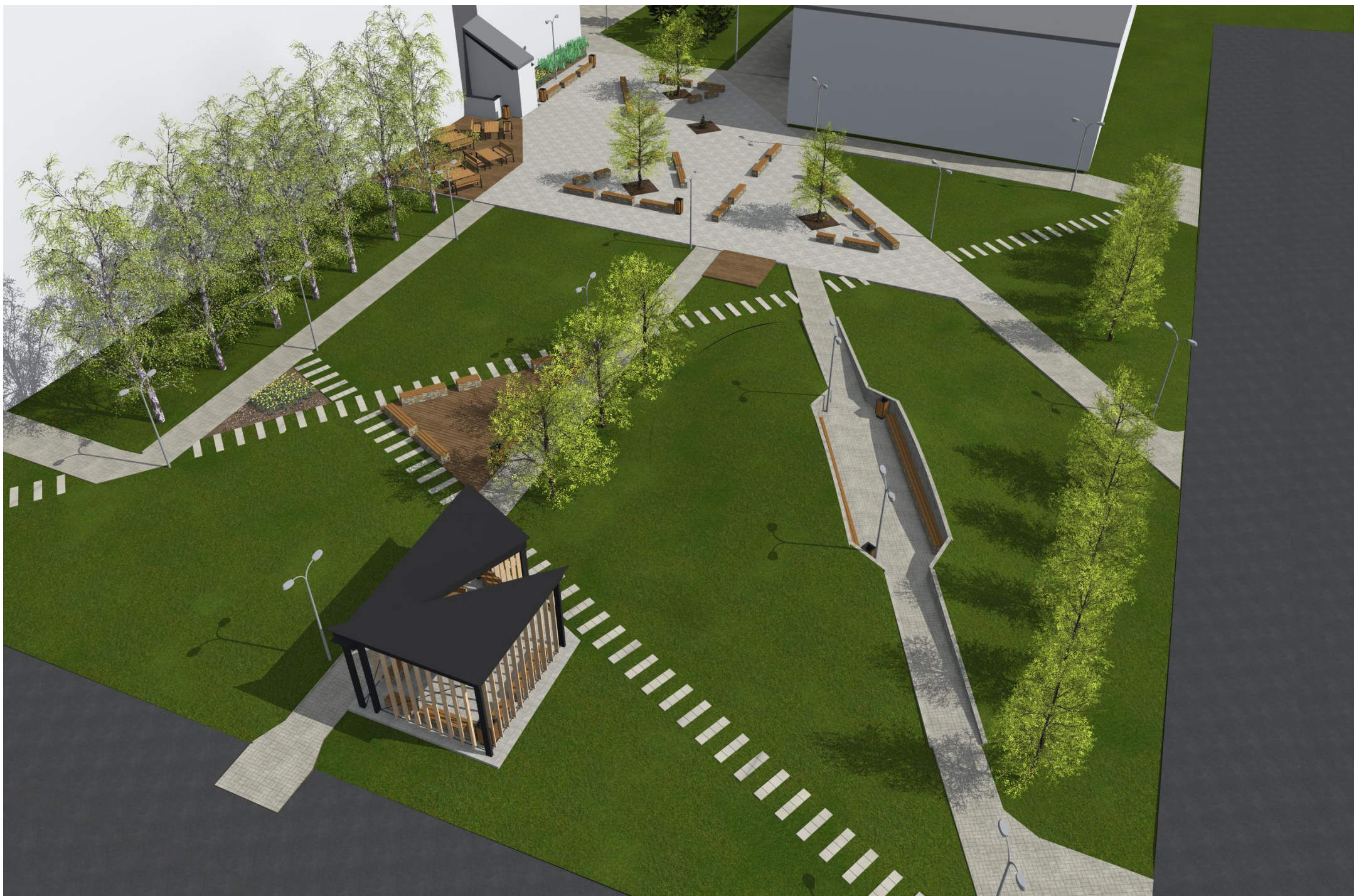
NADHLEDOVÁ PERSPEKTIVA OD SEVEROZÁPADU