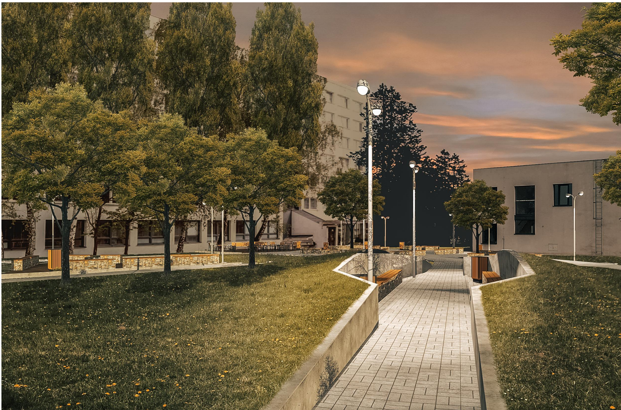
VIZUALIZACE TERÉNNÍHO VALU