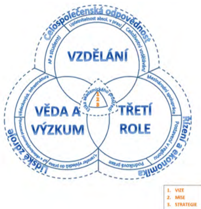
Schéma 1 – Strategický rámec udržitelného rozvoje VŠTE v Českých Budějovicích

Strategický rámec udržitelného rozvoje VŠTE v Českých Budějovicích je vystavěn na integrálním pojetí tří stavebních kamenů VŠTE, a to VZDĚLÁNÍ – VĚDA A VÝZKUM – TŘETÍ ROLE (schéma 1). Tento imperativ je ukotven v rámci řídicího a rozhodovacího systému školy – ETMS. Společenská zodpovědnost není deklarována či separátně zajišťována při individuálních akcích školy, ale je realizována v rámci všech institucionálních procesů odehrávajících se v jejím akademickém prostředí.