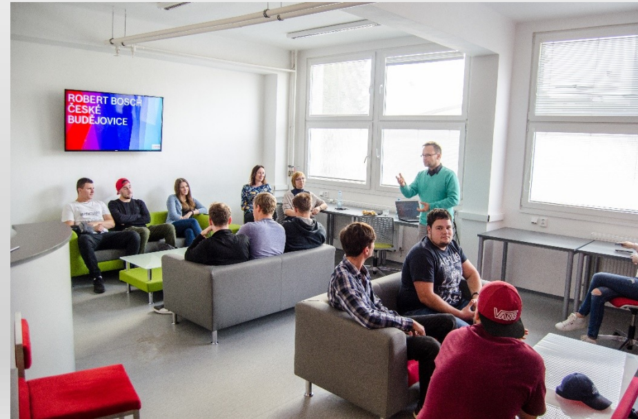
Kariérní centrum VŠTE