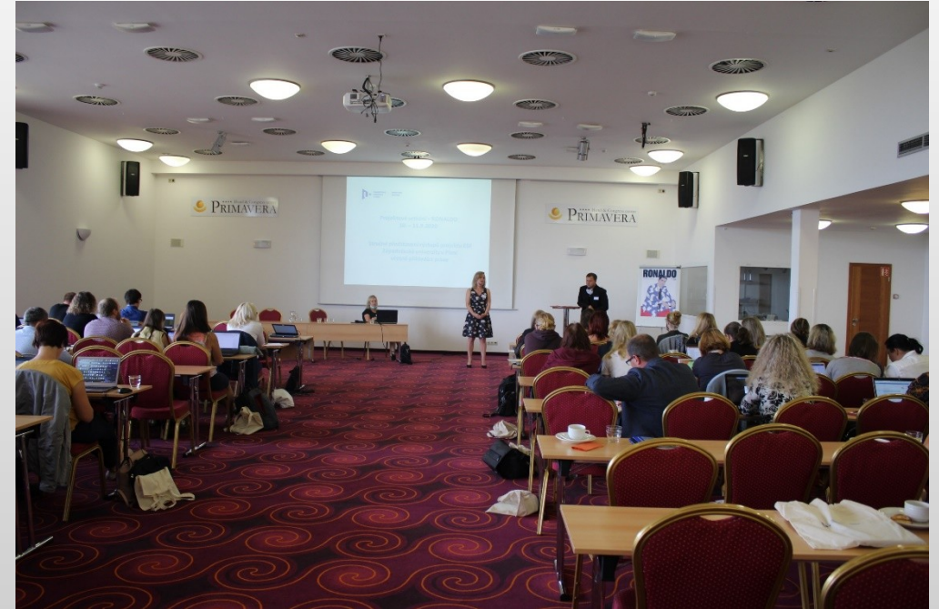
Odborné školení, které se konalo v Plzni 10. – 11. 9. 2020