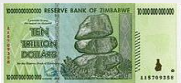
Десять триллионов долларов Зимбабве