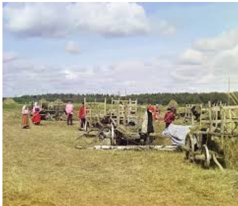
Raný barevný snímek Sergeje Prokudin - Gorského okolo roku 1909