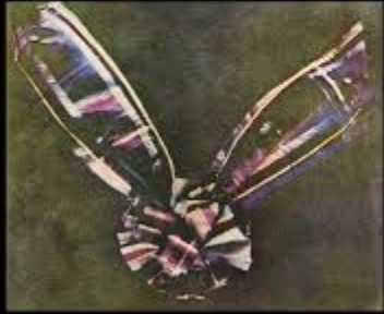
Stužka, první barevná fotografie, James Clerk Maxwell, 1861