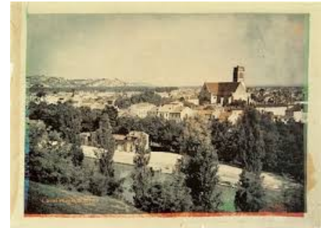
Pohled na Agen, Francie roku 1877 od Louise Duconse du Haurona, francouzského průkopníka barevné fotografie